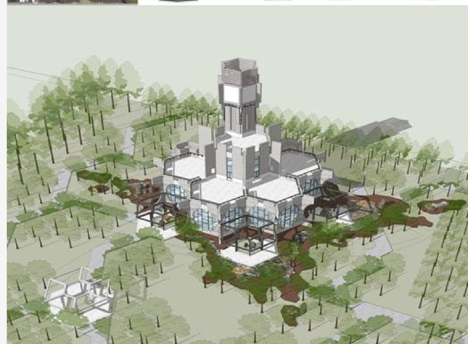
高校学生信息服务中心设计