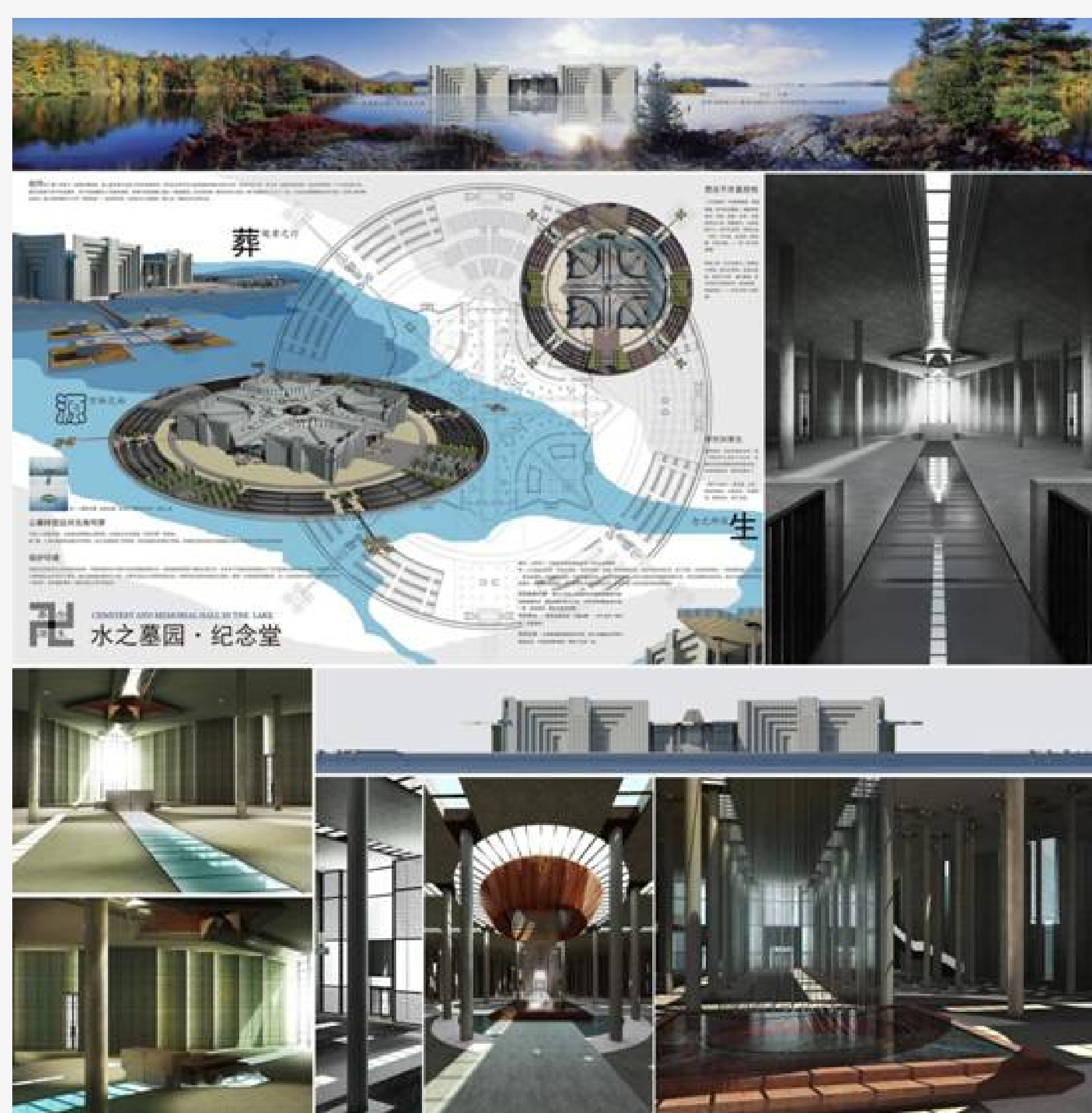
水之纪念馆建筑及空间设计