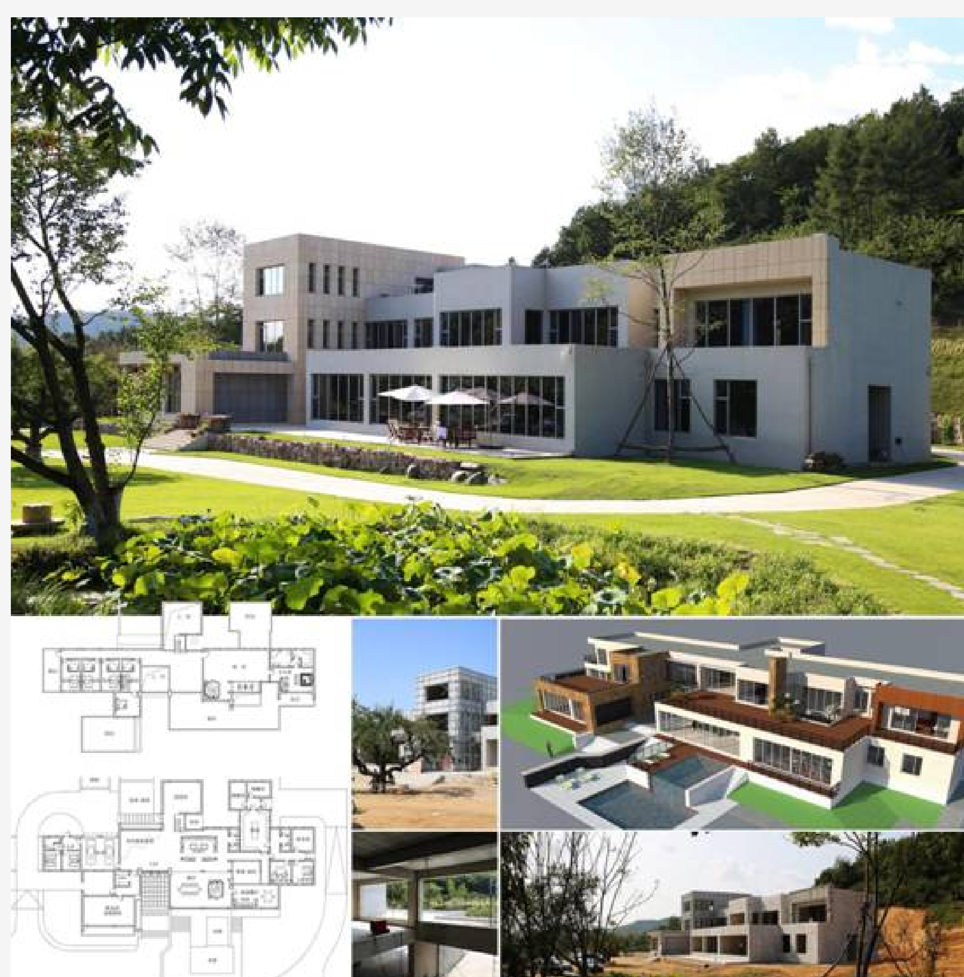
北方山地酒庄度假别墅设计