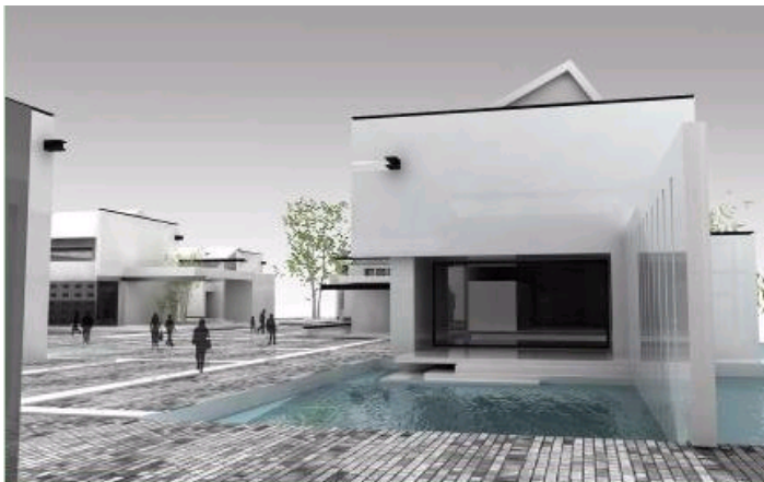
6. 杭州火车东站站前广场概念设计