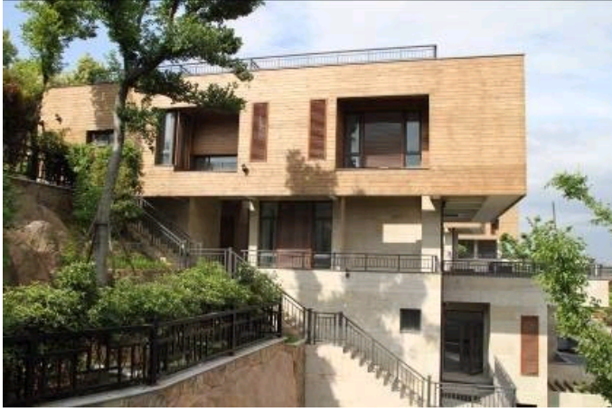
西湖小学立面改造