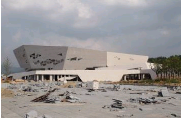
4. 江苏省宿迁市大剧院及文化中心 (竞赛中标)