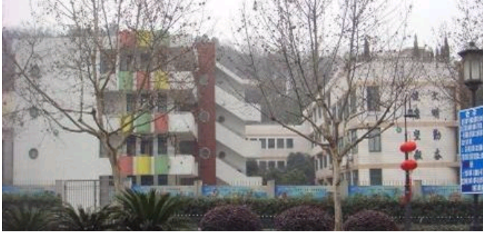
富阳市供电局新电力生产调度大楼（竞赛中标）