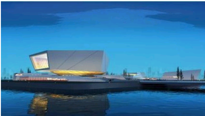
5. 浙江安吉报福旅游集散中心