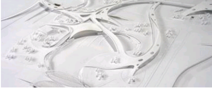
中都青山湖畔山地住宅