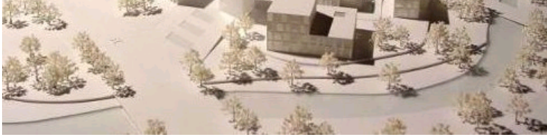
3. 安吉龙山体育中心 (竞赛中标)