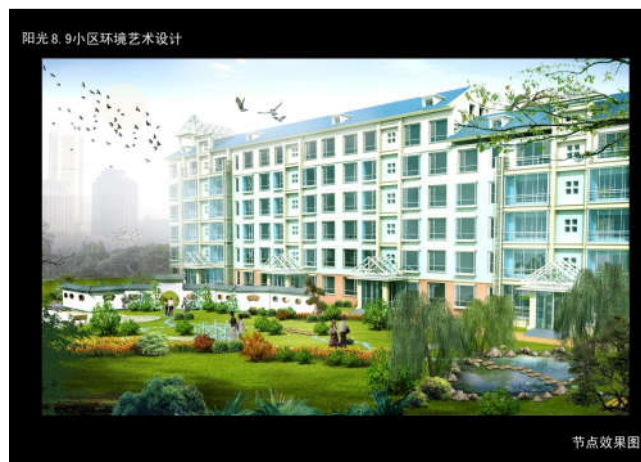
“滨海怡城、西双塘、永和上城、阳光8&9”景观艺术设计，2010年