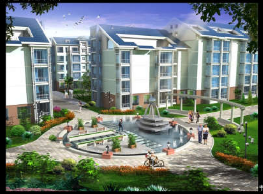
阳光8.9小区环境艺术设计