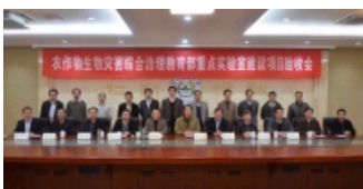
农作物生物灾害综合治理教育部重..