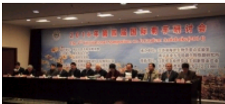
第四届国际菊芋研讨会在南农举办..