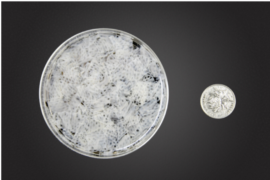
培养出网状肌肉组织

2019年11月18日，南京农业大学周光宏教授团队研发出了国内第一块细胞培养肉。