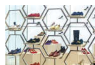
新光天地辟女鞋专区