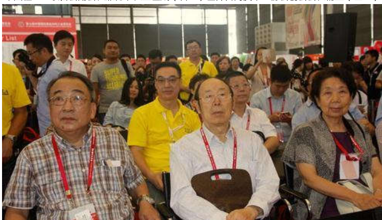
中国皮革协会原会长徐永(中)和张淑华(右一)