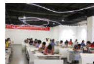
全国皮具设计制作技能