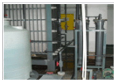
AOUT酸处理液在线更新...