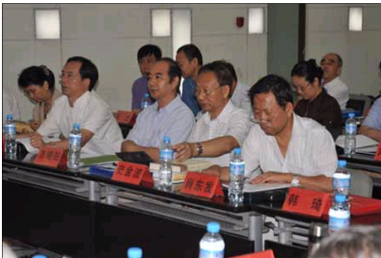
印协印刷史研究委员会换届工作会场

研究会8年的工作情况。《第一届中国印协印刷史研究会工作报告》从印刷史研究会建立的缘起、印刷史研究会筹建以来的各项工作、印刷史研究会建立以来工作的几点体会、并对今后印刷史研究会工作的建议等方面作了详细的阐述。随后，武会长又作了第一届中国印协印刷史研究会委员会财务报告。