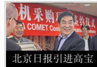
北京日报引进高宝