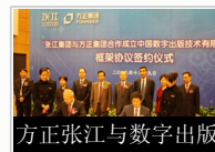
方正张江与数字出版