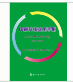
印刷科技实用手册...