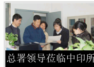
总署领导莅临中印所