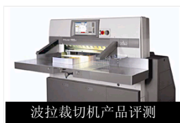
波拉裁切机产品评测