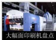
大幅面印刷机盘点