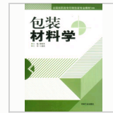
包装材料科学 (" ...