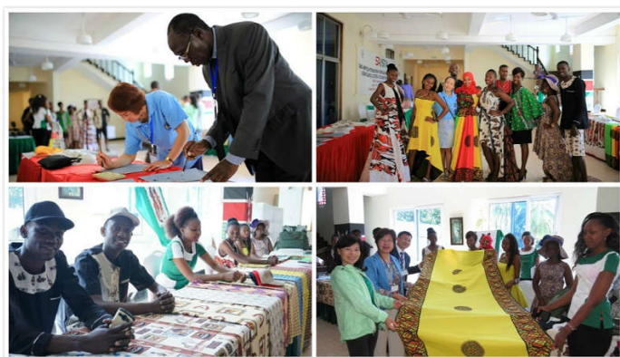
(孔子学院在论坛开办期间组织中非文化互动活动)