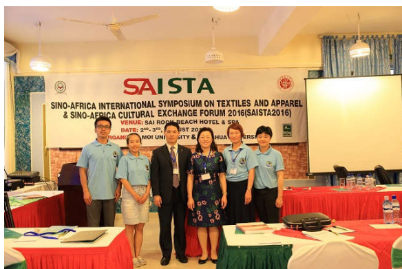
(校领导与孔子学院师生在一起)

据了解，作为以纺织、服装、材料等学科见长的高等学府，我校与非洲高校的学术交流与教育合作由来已久。学校许多相关学科专业的知名专家、教授都投身到教育援非的队伍中来，助力非洲高校纺织服装人才培养。他们不仅面向肯尼亚等非洲国家招收留学生，为学生传授专业的纺织教育知识，还不远万里“主动送上门”，依托类似中非国际纺织服装论坛等学术交流机会，千方百计地与非洲同行切磋交流技艺，实地问需于“非”。也正是在这样的“你来我往”中，我校逐渐在中非纺织服装教育交流与合作中、在服务国家“一带一路”战略发展中发挥着越来越重要的作用。2010年，我校获批教育部“中非高校20+20合作计划”，为非洲国家培养纺织专业高级专门人才。2015年，在莫伊大学建立了全球首所纺织服装特色孔子学院，肩负起汉语言教学和中国文化传播的重任，当前，更是积极致力于搭建中非纺织服装和中非文化交流平台，努力探索教育援非的内涵及实效，将中非和两校之间的合作推向新阶段。