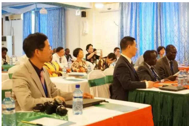
(东华大学十余位专家学者参会)