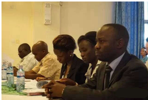
(来自一带一路沿线的十余个国家的学者和企业人员参会)