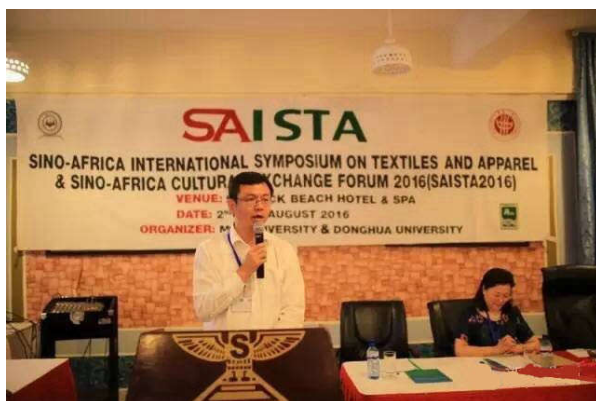
( 中国驻肯尼亚大使馆参赞姚明致辞 )

中国驻肯尼亚大使馆参赞姚明、肯尼亚外交和国际贸易部经济与国际贸易司司长尼尔森·尼达拉古、肯尼亚莫伊大学校长米贝等领导和嘉宾出席论坛并致辞，均对此次论坛在促进中非纺织服装文化交流、推动教育、纺织服装产业等发展方面具有的重要价值与意义表示充分肯定。