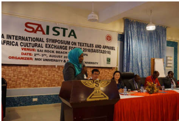
(2016年中非国际纺织服装论坛暨中非文化交流论坛现场)

8月3日，由我校与肯尼亚莫伊大学合作举办、莫伊大学及莫伊大学孔子学院承办的2016年中非国际纺织服装论坛暨中非文化交流论坛在肯尼亚蒙巴萨落下帷幕。这是该论坛首次登陆非洲国家。来自我校以及肯尼亚、乌干达、苏丹、埃塞俄比亚、坦桑尼亚、津巴布韦等十余个一带一路沿线国家的近50位专家学者和嘉宾与会，中非两地专家普遍认为，中非在纺织服装教育及相关产业领域合作前景十分广阔，论坛受到新华社等媒体关注。