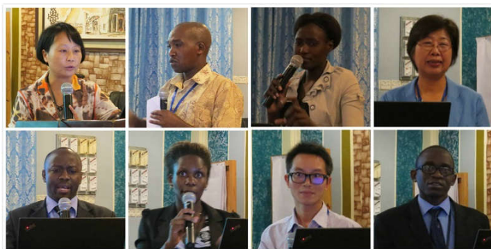
(近20位中非专家在论坛上作主题演讲)

据了解，作为以纺织、服装、材料等学科见长的高等学府，我校与非洲高校的学术交流与教育合作由来已久。学校许多相关学科专业的知名专家、教授都投身到教育援非的队伍中来，助力非洲高校纺织服装人才培养。他们不仅面向肯尼亚等非洲国家招收留学生，为学生传授专业的纺织教育知识，还不远万里“主动送上门”，依托类似中非国际纺织服装论坛等学术交流机会，千方百计地与非洲同行切磋交流技艺，实地问需于“非”。也正是在这样的“你来我往”中，我校逐渐在中非纺织服装教育交流与合作中、在服务国家“一带一路”战略发展中发挥着越来越重要的作用。2010年，我校获批教育部“中非高校20+20合作计划”，为非洲国家培养纺织专业高级专门人才。2015年，在莫伊大学建立了全球首所纺织服装特色孔子学院，肩负起汉语言教学和中国文化传播的重任，当前，更是积极致力于搭建中非纺织服装和中非文化交流平台，努力探索教育援非的内涵及实效，将中非和两校之间的合作推向新阶段。