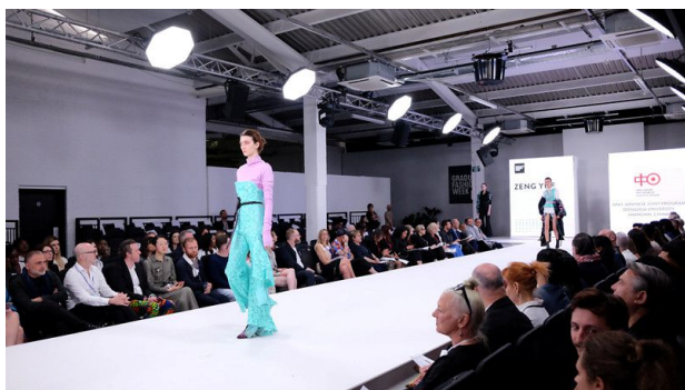
(从“东华时尚周”“上海时装周”到“伦敦毕业生时装周”，三级进阶通路助力学生走上世界舞台)

服装与艺术设计学院已与包括世界五大时尚之都著名服装院校在内的10个国家的23所著名服装艺术院校开展多种形式合作，是国际服装技术院校基金理事会在国内地唯一成员院校；建立对应9个产业环节的48个校外教学实践基地，28个校企合作研究中心；设计研发系列中国航天员专用服装助力载人航天……以服装科技和时尚设计为显著特色的设计学科在2018年初经国务院学位办批准获得一级学科博士学位授予权，在国内率先形成了本硕博三级时尚设计人才培养的完整体系。新华社、中新社、英国BBC电视台等国内外众多媒体记者采访报道，时尚设计教育的中国模式，受到同行、媒体和公众的肯定。