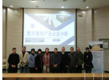
中国高校科学与艺术创意联...