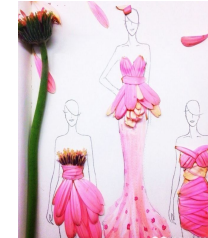
花瓣时装：让你看得见的花香