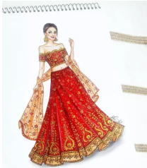
马克笔、彩铅的手绘礼服婚纱