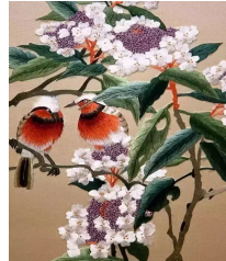
中国最贵刺绣欣赏，真是太美