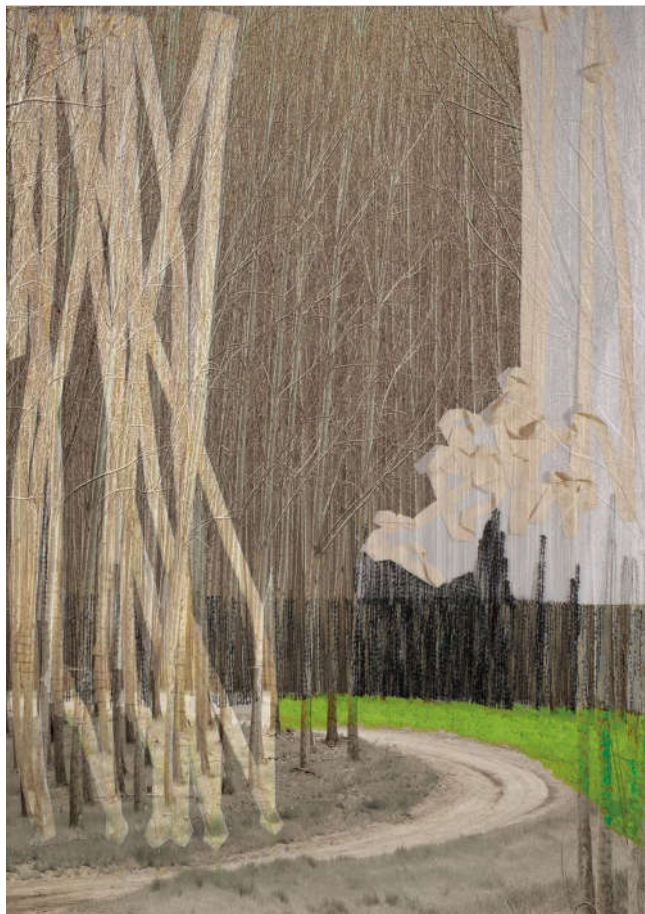
共同的根，共同的魂，共同的梦1