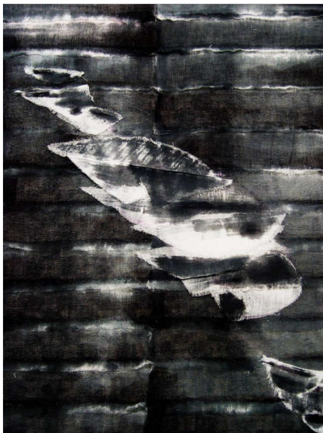
薛艳《波影缤纷局部1》200x250cm 纱棉