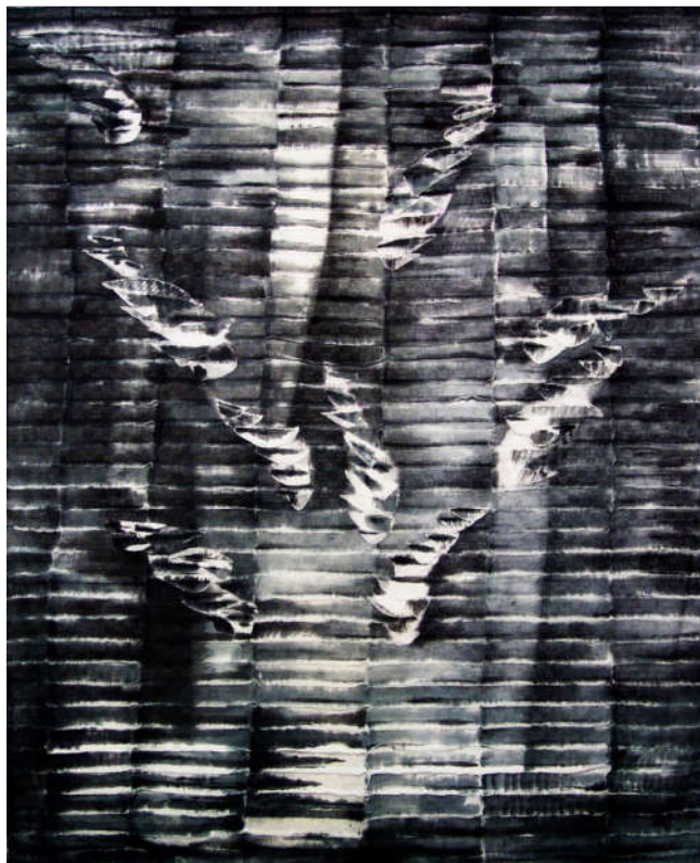
薛艳《波影缤纷》200x250cm纱棉