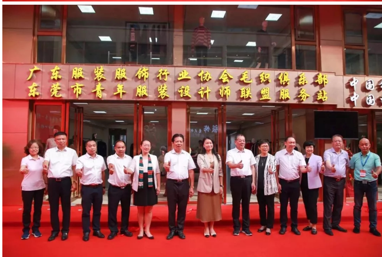
嘉宾进行揭牌仪式