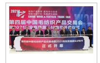
加速扩内需战略落地