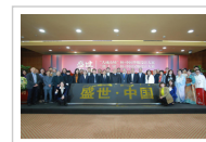
传承中华民族服饰文化