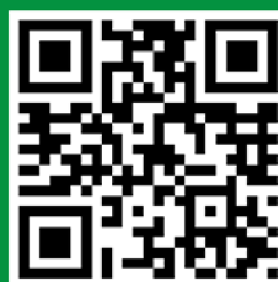
中国造纸学会官方公众号