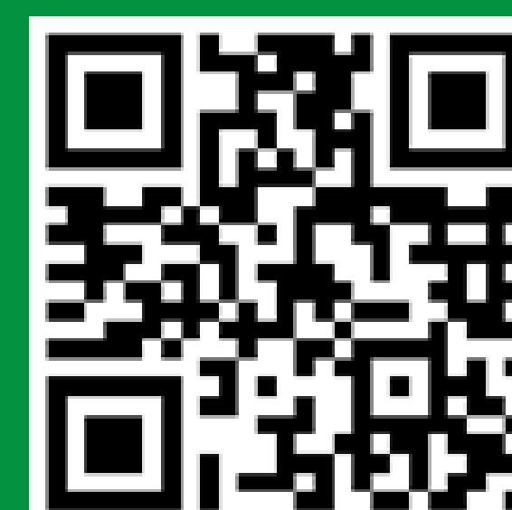
中国造纸学会官方公众号