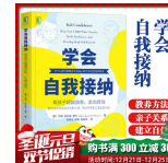
学会自我接纳 帮助孩子超越自卑 走向自信