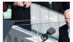
美国: 拜登宣誓就统

Copyright © 2000 - 2021 XINHUANET.com All Rights Reserved.