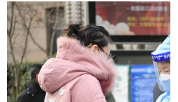
河北: 石家庄启动检测