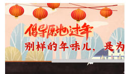
就地过年: 别样的更好地团圆