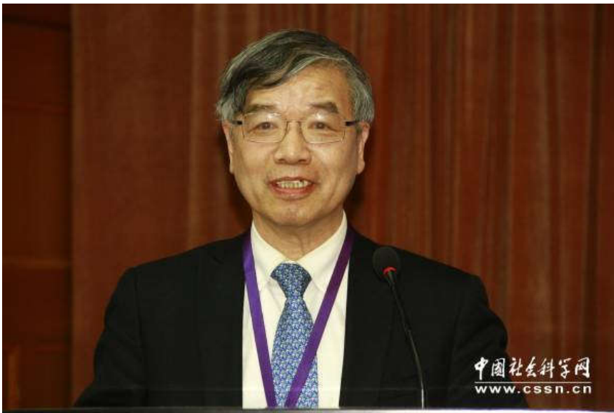
上海社会科学院副院长、智库研究中心理事长黄仁伟发布《2016年中国智库报告》（中文版）