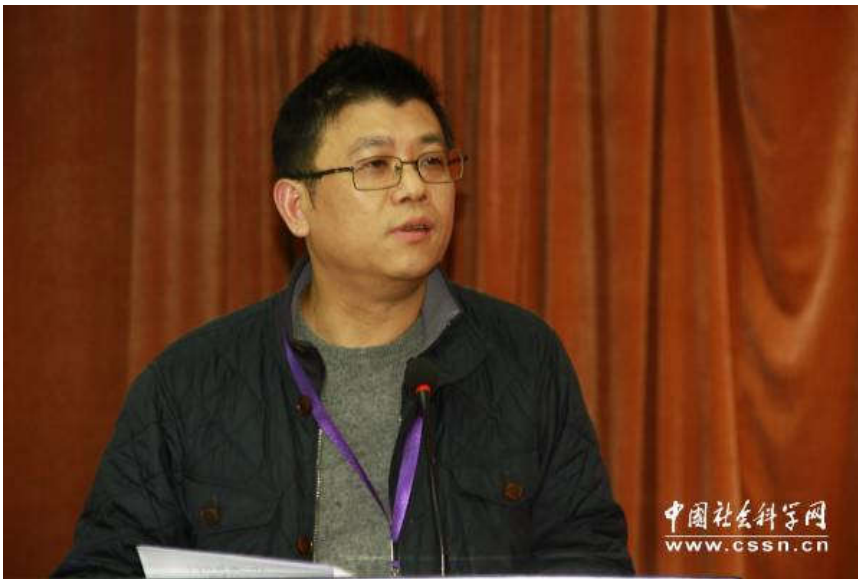
上海市人民政府发展研究中心主任肖林发言