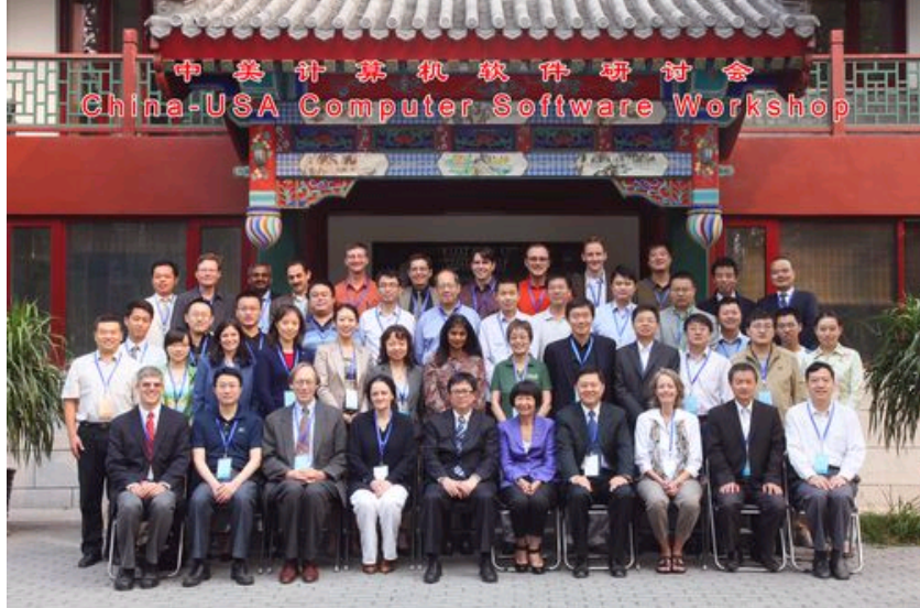
会后与会嘉宾合影留念