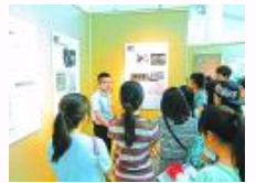
我国智库建设进入井喷期 高校成为新型智库排头