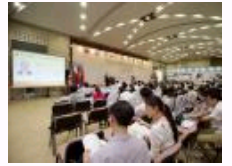
人民大学举办十二国智库论坛 首议“丝绸之路经