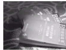
关于建设中国特色新型智库的调查与思考