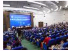
中国社会学会2014年学术年会在武汉大学召开