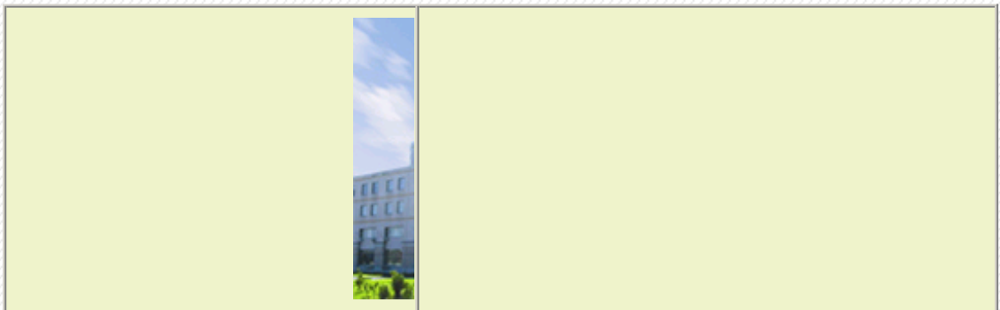
+应用光学国家重点实验室