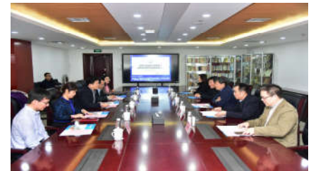
北京邮电大学与北京市版权局共商科研工作