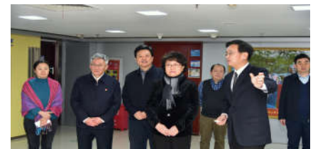
教育部党组成员、副部长翁铁慧到北京邮电大学调研