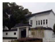
无锡周氏老宅曝光