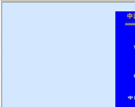
+中国科学院激发态物理重点实验室