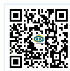
扫描二维码加入中国电子学会会员