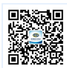
扫描二维码关注中国电子学会公众号