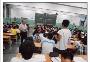
杰出校友戴林与信息学...