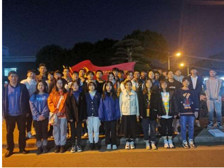
附件1: 2021年全国大学生电子设计竞赛获奖名单(初评)

本网讯（通讯员 吕植成）近日，2021年全国大学生电子设计竞赛决赛落幕，信息与通信工程学院代表队获国家二等奖2项，创参赛史以来最好成绩，同时获得湖北省一等奖2项、二等奖3项、成功参赛奖2项。在全国决赛中，信息与通信工程学院代表队的作品《用电器分析识别装置》、《基于互联网的摄像测量系统》突出重围，均获国家二等奖。在省赛中，参赛队伍也是大放异彩，共揽获省级奖项7项。