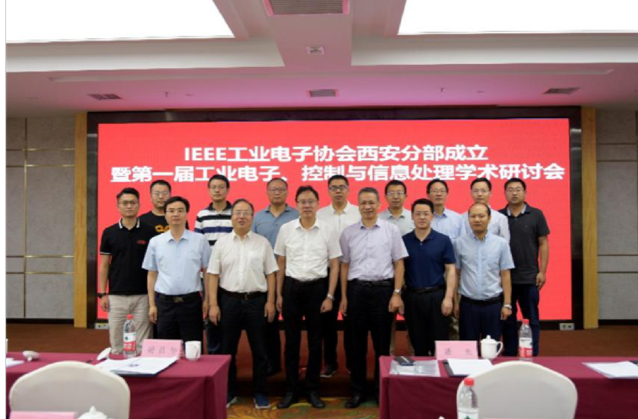
会议参会专家合影

西工大新闻网7月7日电(张卓) 2021年7月3日,“IEEE工业电子协会西安分部成立暨第一届工业电子、控制与信息处理学术研讨会”在西北工业大学翱翔国际会议中心举行,此次会议由IEEE工业电子协会西安分部主办,西北工业大学航海学院承办,来自西安IEEE分会、IEEE工业电子分部的教师代表以及学生参加了会议。