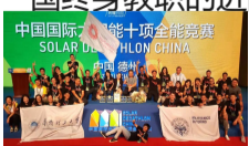
青春逐梦人：打造水泥城市中的“月光宝盒”