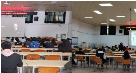
核院2021春季招聘之... 【“核”你一起谋发展】