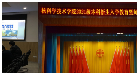
研究员来... 【三全育人】核科学技术学院2021级本科