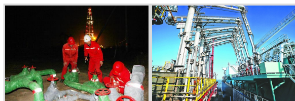
党员带头自查 精准发力 上产