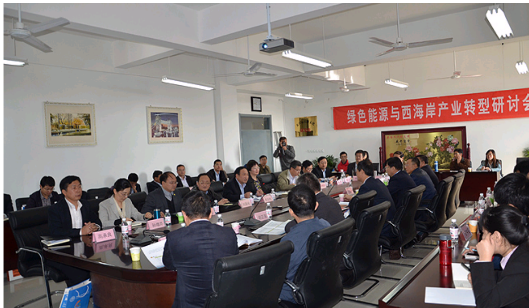
绿色能源与西海岸产业转型研讨会现场

作者: 文学院: 董岩 来源: 本站 发布时间: 2014年10月30日 10:10:33 点击数: