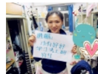
【毕业季】大学四年最遗憾的那些事