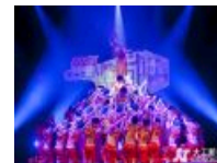
【在现场】关于峰岚杯的几个精彩瞬间