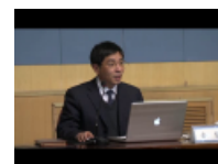
我校十八大代表全变作十八大精神学习辅导报告会