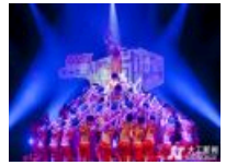
【在现场】关于峰岚杯的几个精彩瞬间