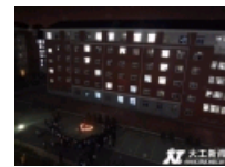
【毕业季】“最大工”——难忘凌工路2号那42件事