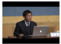
我校十八大代表全变作十八大精神学习辅导报告会