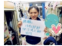
【毕业季】大学四年最遗憾的那些事