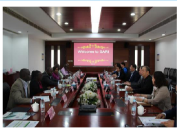
肯尼亚旅游和野生生物部常务副部长来访推进反盗猎合作