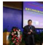
包信和：未来能源自统