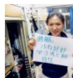
【毕业季】大学四憾的那些事