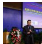
“大煜科学讲坛”信和院士作首场报