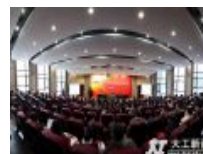
2013年宣传思想工作会议