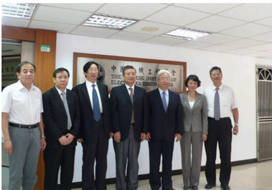
代表团访问了中国电机工程学会（台湾地区）