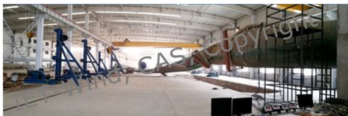
图1 大型风电叶片弯扭耦合荷载下全尺度结构破坏试验

学术成果在复合材料结构研究领域顶级学术期刊 Composite Structures 发表,研究工作得到国家自然科学基金项目(51405468)和国家高技术研究发展计划863项目(2012AA051303)支持。