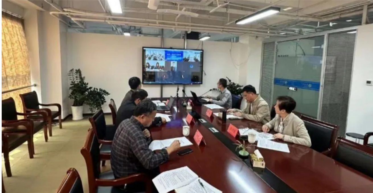
评审会现场 (杭州数亮)

11月8日, 由杭州数亮科技股份有限公司研发的“临西·轴承产业指数”, 经专家组评审, 获得通过。