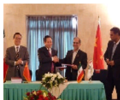
中色股份与伊明胡泽斯坦