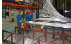
广东华昌铝厂挤压试产开