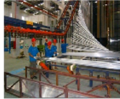
广东华昌铝厂挤压试产开