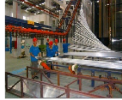
广东华昌铝厂挤压试产开