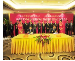
鲁能晋北铝业股权转让暨