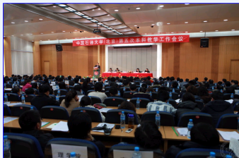
中国石油大学第五次本科教学工作会议隆重开幕