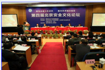
第四届北京安全文化论坛在中国石油大学隆重举行