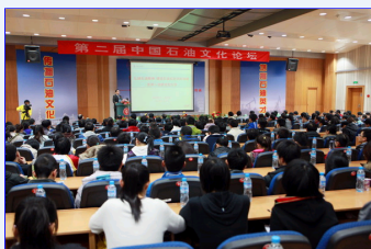
第二届中国石油文化论坛隆重举行