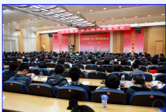
大庆精神、铁人精神报告会在石大举行