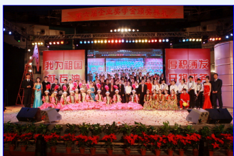
中国石油大学隆重举行第六届企业奖学金颁奖典礼